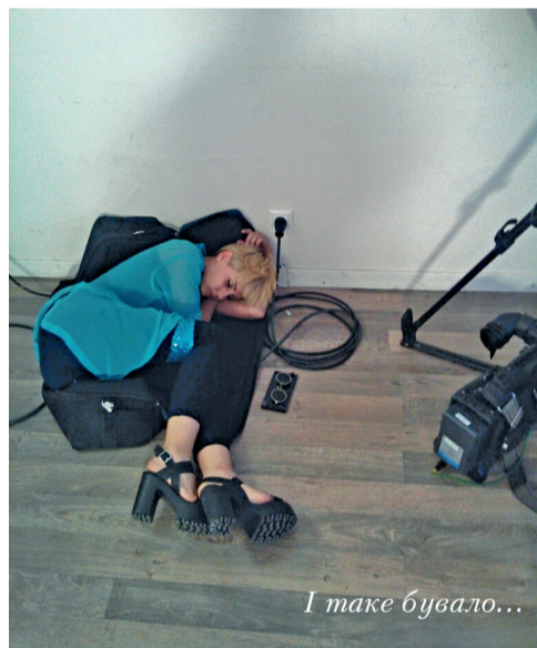
І таке бувало...

Депресія. Стадія, коли ви вже усвідомили складнощі та нюанси формату, але досі не вмієте писати у його вузьких, як джинси молодшого брата-скейтера, рамках. І не слід недооцінювати: формат – це не лише те, яким ви зрештою бачите матеріал на шпальті або на екрані: типу передачі про домогосподарок, яким потрібно дешево нагодувати родину та зробити безпечну люстру з пластикових ложок (без перебільшень). Ні. Не лише. Це і формат загального верстання рубрик в епізодах, навіть формат замовлення техніки та графіки роботи зірок, що приходять говорити вашими словами в ефірі. Це і кошти, які вкладено у проект і які ви маєте зеконотити, але таким чином, щоб результат все одно здавався феєричним! Щоб прогрімало пару вибухів та Брюс Уїлліс особисто ліз вентиляційною трубою, промовляючи вашу пораду з екрана у прайм-