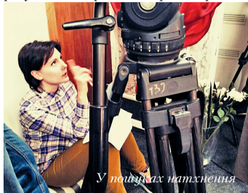
У початках натхнення

Заперечення. Як правило, найдовша і найважча фаза. Залежить від гнучкості нервової системи та вміння гальмувати власну пихатість. Починається одразу після одержання перших правок і