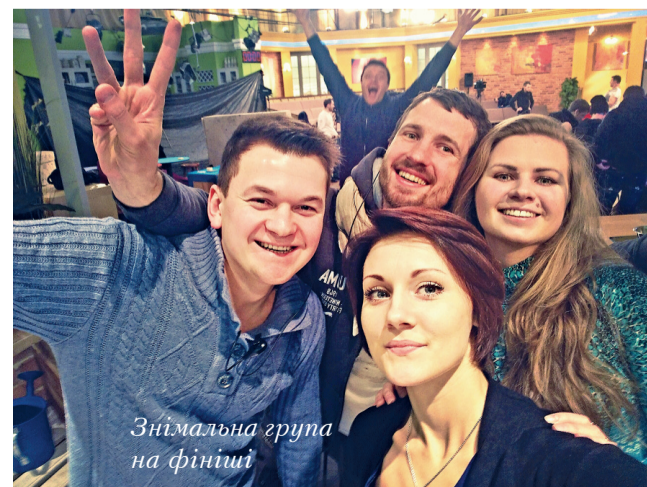
Знімальна група на фініші

P.S.2. І... що б вам не казали на парах, головний на всіх телеканалах – рейтинг. Не бажання правди та все таке інше високе й моральне, а рейтинг. Така реальність. Вибачте. Сама з цим живу.